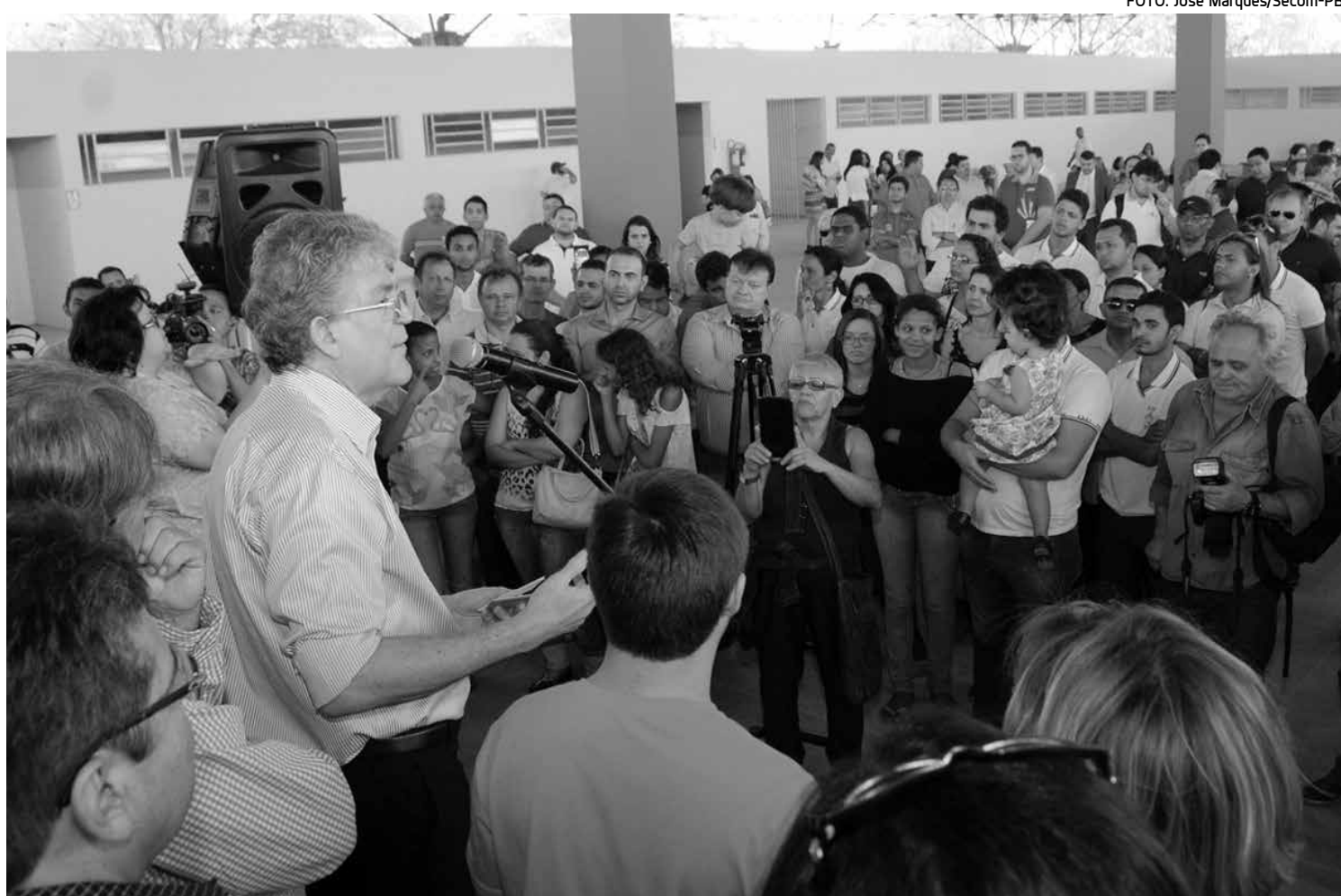
Na oportunidade, o governador anunciou a ampliação e reforma de mais 15 escolas, em CG, e assinou OS para licitar pavimentação da PB-113

Ricardo lembrou que a Escola de Audiocomunicação Demóstenes Cunha Lima estava abandonada e em ruínas e que se sentia feliz em estar entregando a unidade totalmente reformada. “Obras em escolas me deixam muito feliz porque sei que essas obras não são do momento, são de conhecimen-