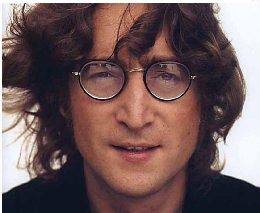
Fundador do grupo britânico "The Beatles", Lennon é um ícone da música

Para ele, agora a bola está do lado das novas gerações. "É a nossa vez de fazer acontecer ou não, realizar, pelo menos em parte, o projeto que ele idealizou. Acho possível, sim, especial-