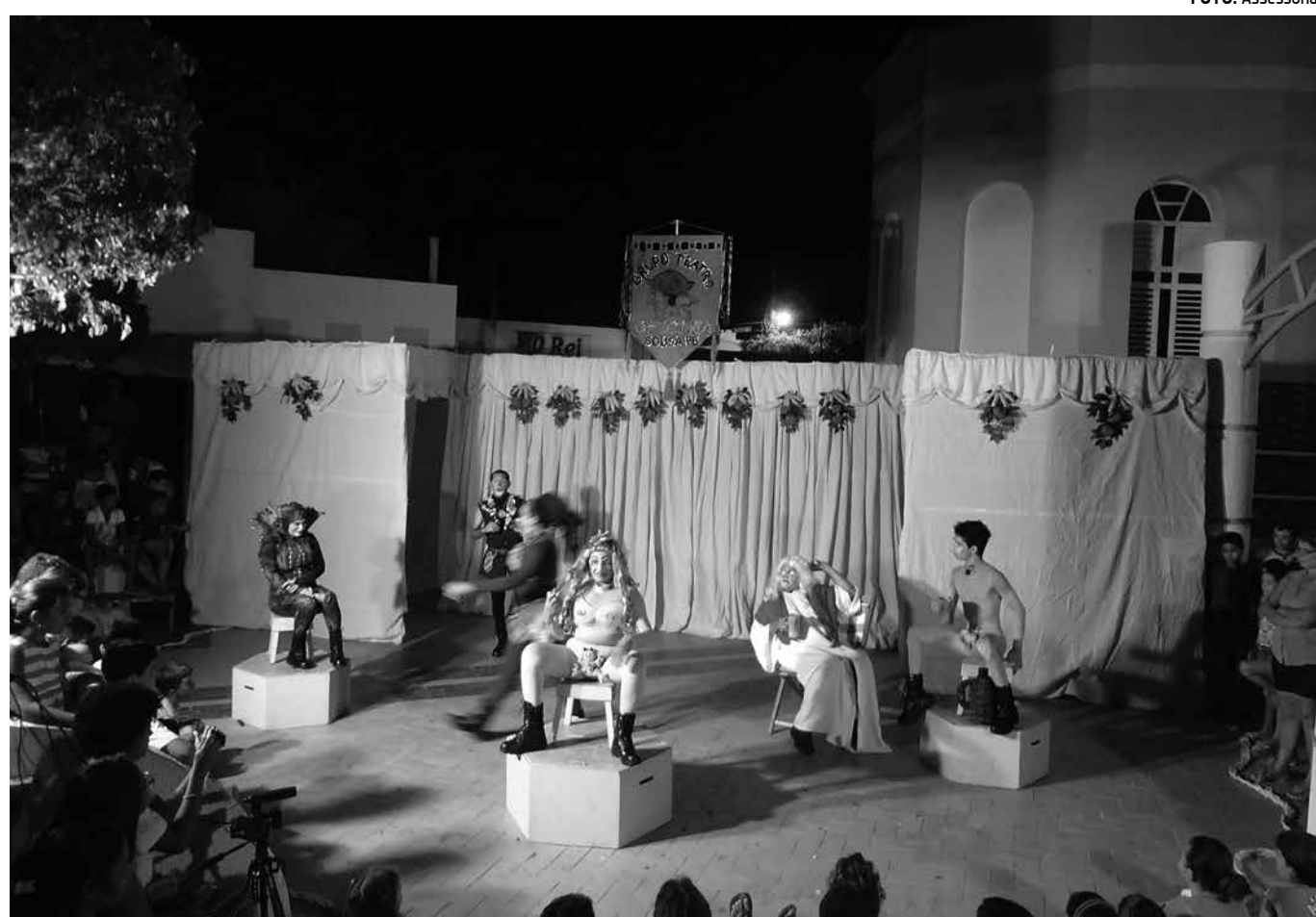
Fragmento do espetáculo "Do Paraíso ao Pindorama" encenado pelo grupo "Teatro Oficina Paraíba"

O público também pode participar de oficinas, palestras e debates que ocorrem em paralelo, além de frequentar feira de livros, exposições e saraus. Trata-se da maior mostra de artes integradas da Paraíba, cujas apresentações e atividades de formação são gratuitas. A programação está disponível no site www.mitpb.com.br , onde também é possível encontrar informações sobre os convidados, as atividades previstas, as sinopses e fotos dos espetáculos.