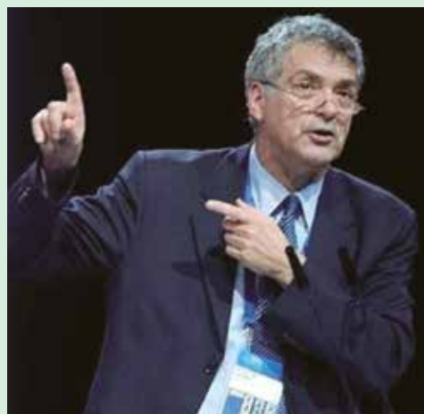
O espanhol Angel Maria substitui a Platini

de presidente da Fifa caberá ao camaronês Issa Hayatou, vice-presidente há mais tempo no Comitê Executivo da entidade; enquanto, na Uefa, a posição será do espanhol Ángel María Villar, primeiro vice-presidente da federação europeia. Juntos, eles somam 54 anos de força no futebol.