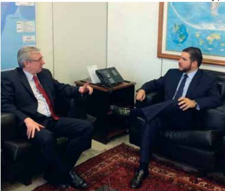
Deputado pede investimentos a ministro de Ciência e Tecnologia