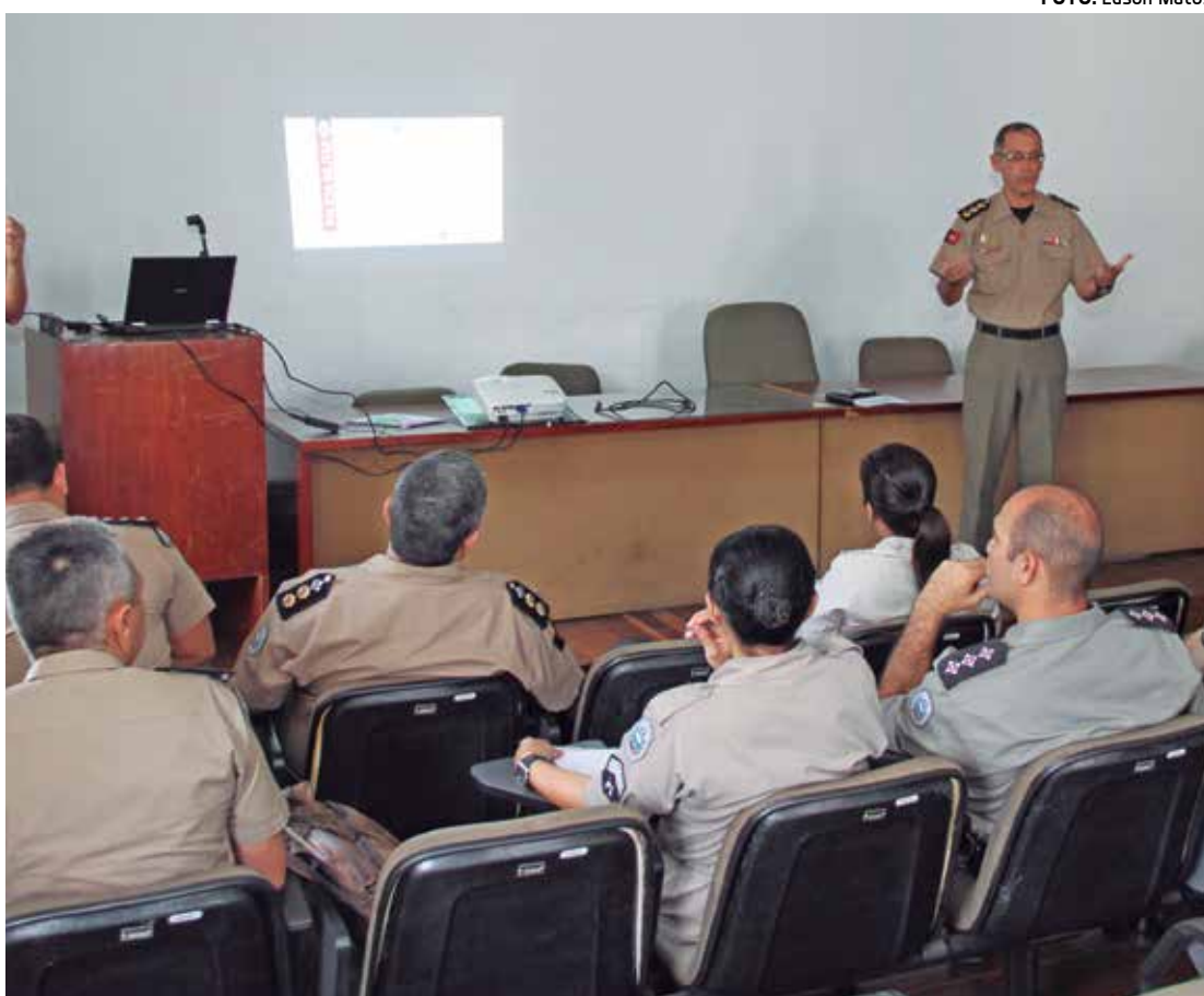
Últimos detalhes do esquema de segurança foram definidos ontem em reunião no Comando-Geral

Na próxima terça-feira, 13 de outubro, haverá reunião também em Campina Grande para esclarecer detalhes técnicos da operação. Nesta reunião, estarão presentes o Comando do Policiamento da Região I (que engloba a região de Campina Grande e Brejo do Estado) e o Comando do Policiamento da Região II (Sertão).