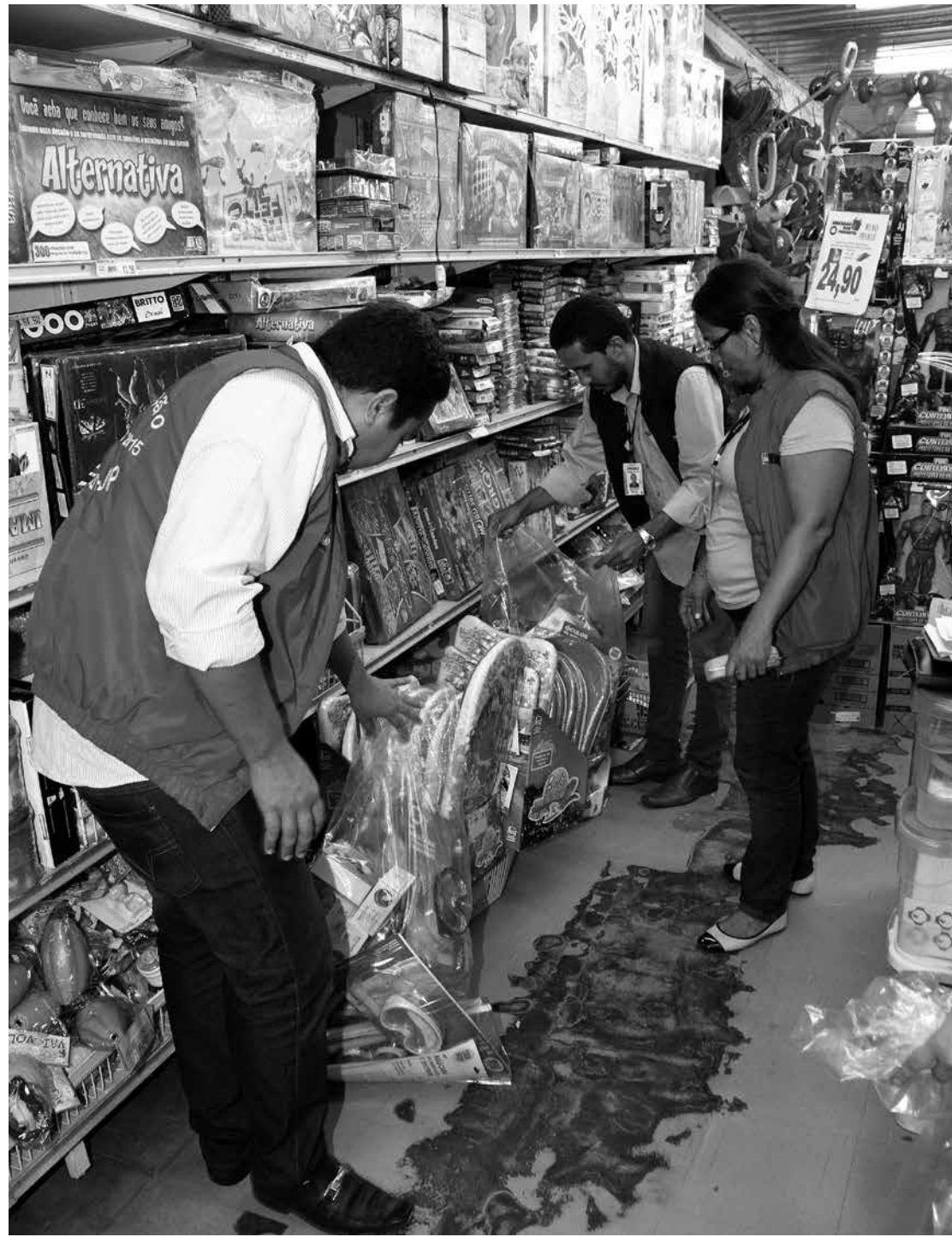
Fiscais verificam se os brinquedos estão de acordo com as normas de segurança do Inmetro

Para evitar esses problemas, o Procon-JP orienta que quem for comprar presente para o Dia das Crianças deve ficar atento aos preços, formas de pagamento, normas de segurança e se certificar de que o brinquedo que a criança está pedindo é o mais adequado. "A nossa ideia é não somente garantir os direitos, bem como conscientizar os consumidores para que também saibam identificar falhas nos produtos ou na comercialização e denunciem ao Procon", informou.