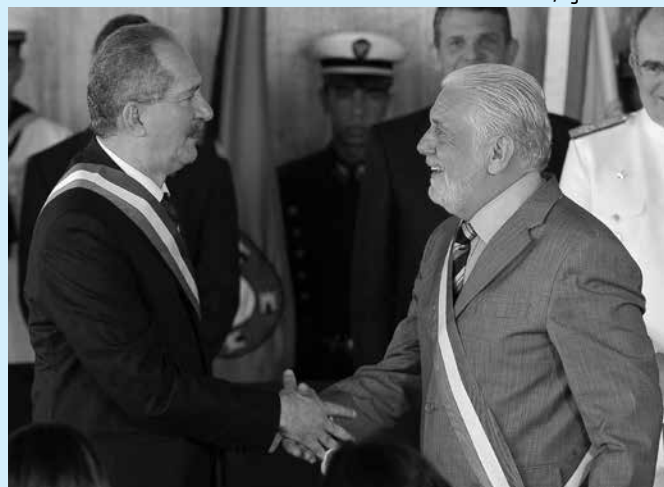
Aldo Rebelo e Jaques Wagner na transmissão do cargo