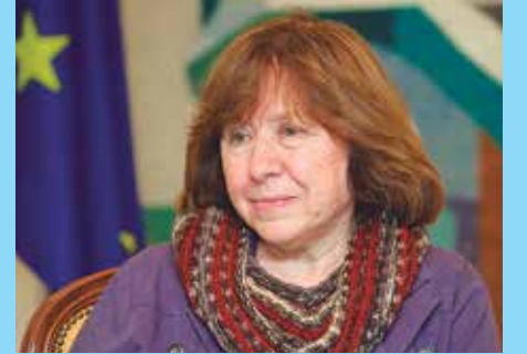
Svetlana, 67 anos, é da Bielorrússia

LITERATURA PÁGINA 5 Svetlana Aleksievitch é a vencedora do Nobel