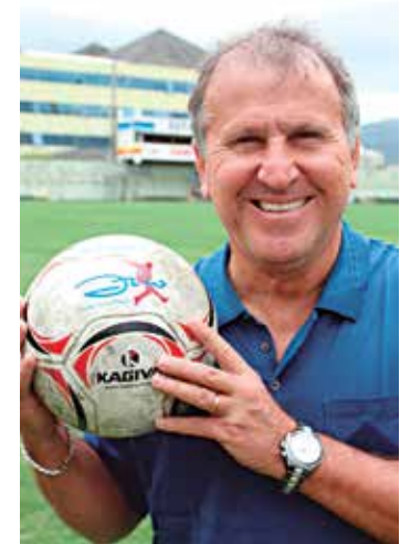
Zico segue candidato à Fifa

O afastamento do mandatário da Uefa, Michel Platini, e a punição ao sul-coreano Chung Moon-jong, que era um dos pré-candidatos pode fortalecer Zico na corrida pela presidência da Fifa. Isso porque dificilmente ambos terão condições de registrar a chapa para concorrer ao pleito. A data-limite para os candidatos formularem suas candidaturas é 26 de outubro. Desta forma, Platini, suspenso por 90 dias de qualquer atividade ligada ao futebol, estava inviabilizado para concorrer. Só conseguiria se houvesse uma reviravolta no caso. O mesmo ocorre para o sul-coreano. No entanto, ele foi penalizado em seis anos.