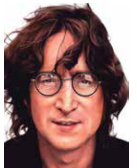
John Lennon: Beatles

No dia em que faria 75 anos, John Lennon tem o legado artístico lembrado e reverenciado. PÁGINA 8