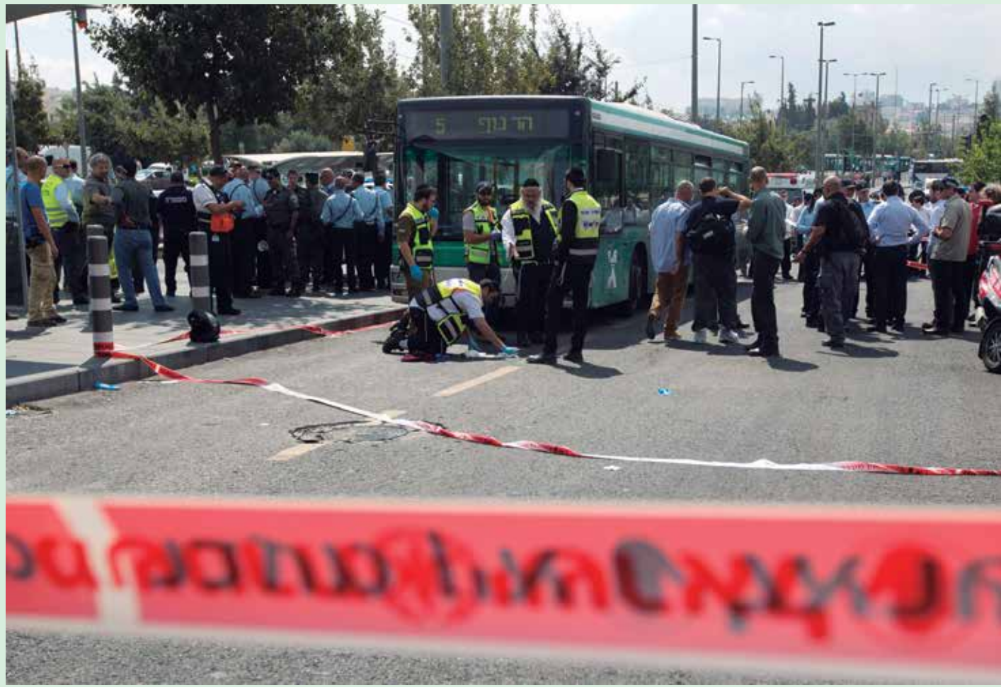
Ao todo, quatro israelenses foram mortos esfaqueados por palestinos, enquanto cinco palestinos foram mortos