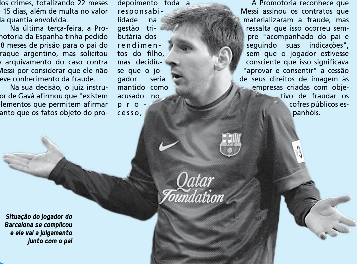
Situação do jogador do Barcelona se complicou e ele vai a julgamento junto com o pai

A Promotoria reconhece que Messi assinou os contratos que materializaram a fraude, mas ressalta que isso ocorreu sempre "acompanhado do pai e seguindo suas indicações", sem que o jogador estivesse consciente que isso significava "aprovar e consentir" a cessão de seus direitos de imagem às empresas criadas com objetivo de fraudar os cofres públicos espanhóis.